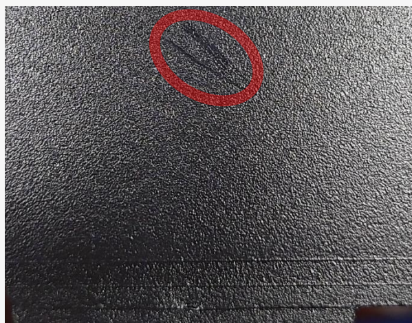
ベースの不良品画像